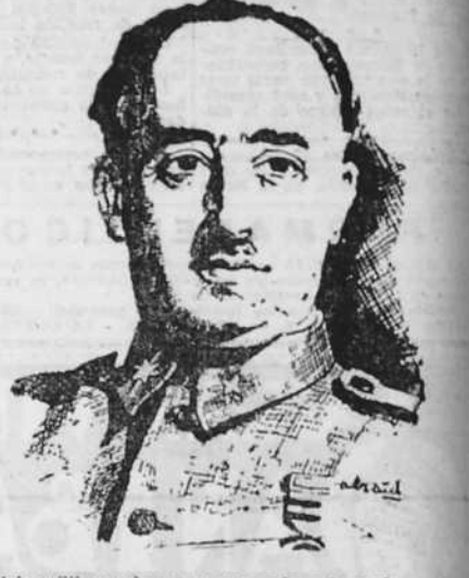
Portrait of General Queipo de Llano.

Después de la guerra, ¿piensa hacer de España una gran potencia militar, con un gran Ejército, una Aviación fuerte y una gran Armada?