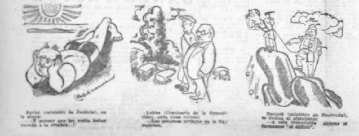
Cartoon illustrating the vacation of French politicians.