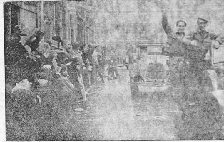
GIJÓN.—Un aspecto de los depósitos de gasolina incendiados por nuestra Aviación cuando la citada población estaba todavía en poder de los marxistas. Abajo, la entrada de nuestras fuerzas en la ciudad liberada; el público aclama a los vencedores que responden con vítores a España y a Franco.

El martes los delegados de todos los Gobiernos darán cuenta de su posición ante el plan británico. Antes de fin de semana se quiere tener resuelta la manera de hallar una fórmula de concordia entre la tesis mantenida por Rusia, por un lado, y la mantenida por Italia, Alemania y Portugal, por otro.