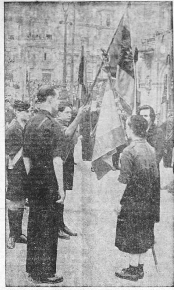
La madrina de la Bandera nacional al entregada ayer a los Flechas en la Plaza de María Pita, pronunciando su discurso al depositar la sagrada enseña en manos de los pequeños camaradas de la Falange Española Tradicionalista y de las JONS

Pues esas fuerzas están vencidas, y las regiones que oprimían dominadas. Ahora, el mando nacional tiene una absoluta libertad de movimientos para atender a otros objetivos esenciales. El desastre de Asturias después de los de Vizcaya, Santander y Gulpizcos, es el principio del fin. Anuncia la ya próxima e inevitable catástrofe roja.