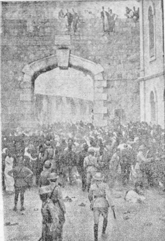
Continúan en Palestina los desórdenes provocados por los árabes como protesta contra el proyecto inglés de separación del territorio musulmán...