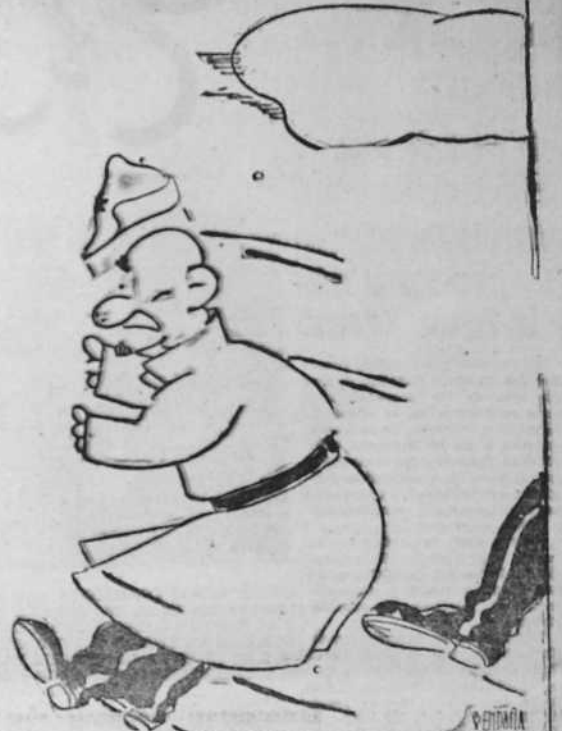
MONOS DEL DIA NO INTERVENION Por BENDASAR

LAS NECESIDADES DEL MOMENTO CREAN EL VALOR DE LAS COSAS. HOY EN DIA LA CHATARRA ES METAL RECTOSO, Y ESPERA PIDE SU ENTREGA GENEROSA. OFERTAS A LA COMISION PROVINCIAL, CANTON GRANDE, 8, PRIMERO. TELEFONO 2337.