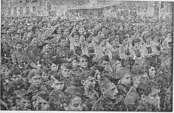
SOBRE ESTOS CORAZONES SANOS, CON ALAS DE ANGELES, SE LEVANTARA LA NUEVA ESPAÑA, BAJO LA EGIDA DEL CAUDILLO Y EL EMPUJE FERVOROSO DE LAS FLECHAS Y EL YUGO DE NUESTRA UNIDAD. CULTIVEMOS LA ALEGRIA DE ESTAS ALMAS QUE SE ABREN A LA VIDA DE LA PATRIA EN UN AMANECER LLENO DE GRANDEZAS Y DE NOBLES AMBICIONES DE JUSTICIA Y DE PAZ

"Muy señor mío: "He recibido su carta y me he hecho leer, además del prólogo de Paul Claudel, la mayor parte del libro de usted y especialmente sus páginas más características. "Esta obra es impresionante. Ennoblecida por el prefacio de Paul Claudel, constituye la más contundente justificación de la lucha emprendida por la España Nacional contra los enemigos de Dios y de la Patria. En este libro se exponen hechos ante los que todo adversario de buena fe no puede menos que inclinarse. "Usted sabrá ya, de todos modos, que, por mi parte, no he tenido jamás necesidad de que se me convenciera de la justicia de nuestra causa. Me uní a la España católica, tantos lazos, que yo he sufrido de todo corazón con ella, a consecuencia de las persecuciones y del verdadero martirio que ha venido sufriendo. Pero, afortunadamente, parece ahora, como dice Paul Claudel, que "el tiempo de la rotación ha terminado y ha llegado la hora de la siembra". ¡Que Dios conceda una victoria rápida y definitiva a quienes son a la vez los soldados de Cristo y de la civilización cristiana! "La carta tan categorica, tan elocuente, de su Eminencia el Cardenal Verdier, que acaba de aparecer, ha debido ser confortadora para el corazón de nuestros amados compatriotas. "Agradeciéndole su envío, quedo suyo afmo., en Jesucristo, ALFREDO, Card. Baudrillat. (firmado)."