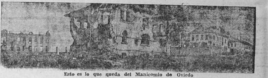
Esto es lo que queda del Manicomio de Oviedo

El sargento Michelin es un hombre popularísimo en Vetus-ta. Sin haber jamás empuñado un fusil, puesto que no le correspondió prestar el servicio militar en sus años mozos, el día en que el coronel Aranda se arriesgó a dar el golpe salvador sintió en su interior algo que le impulsaba a conocer los fáciles aunque peligrosos secretos de un "mauser", y en la noche memorable del 19 al 20 de julio de 1936 abandonó el hogar donde vivía placidamente y se encaminó al cuartel de Pelayo, luego de haber dejado en su ca-