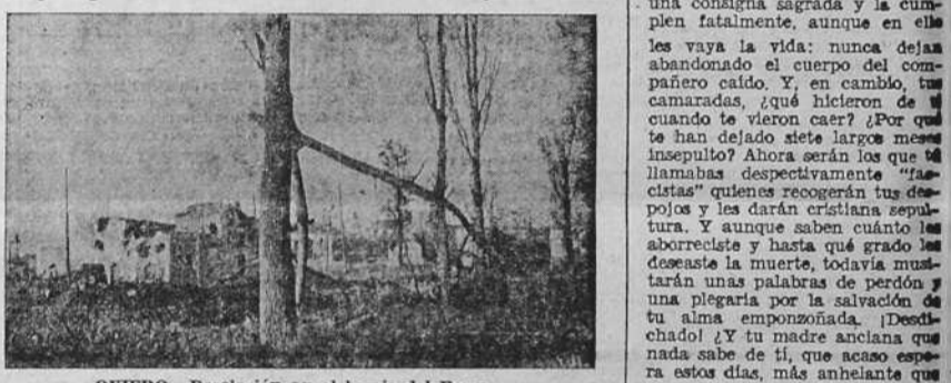
OVIEDO.—Desolación en el barrio del Fresno