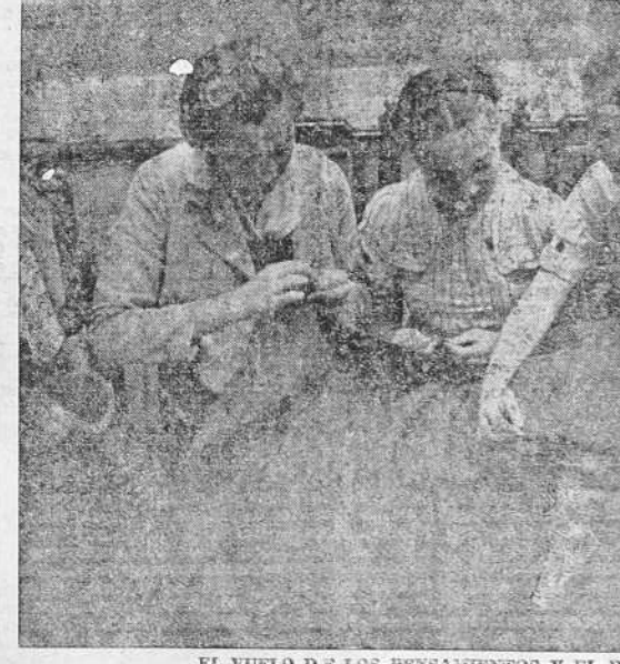
EL VUELO DE LOS PENSAMIENTOS Y EL DE LAS MANOS. Ni la fatiga puede ser causa que justifique el apartamiento de lo que pide España... Los que sufren y lo arriesgan todo, no la ponen cuando dan a la Patria su vida entera, minuto a minuto. Tú, mujer de España, entrégales el vuelo de tus pensamientos y el de tus manos.

ZARAGOZA 3.—Persiste el mal tiempo en toda la región aragonesa. Las inundaciones han obligado a los rojos a abandonar algunas de sus posiciones. En el sector de Barbastro llegaron hasta los límites de esta localidad.