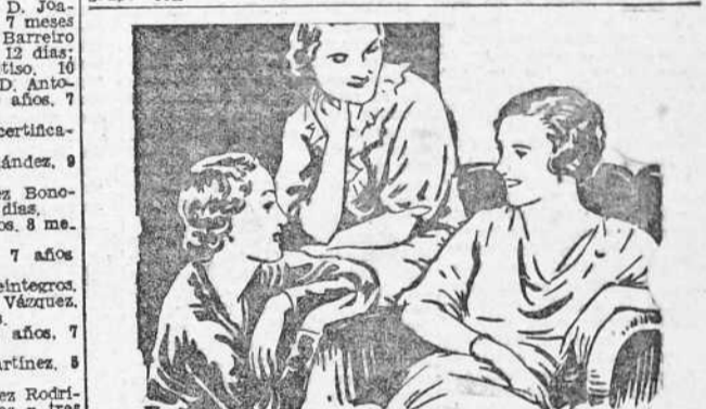
Las MARTIRES de ayer son ahora personas tranquilas y contentas.