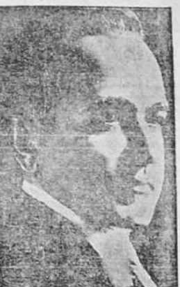
EL PRESIDENTE GETULIO VARGAS