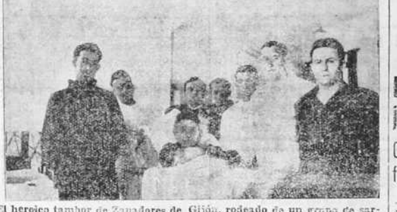
El heroico tambor de Zapadores de Gijón, rodeado de un grupo de soldados, como él hospitalizados en el H. Militar num. 2.

—Sigue, sigue contando... —Ese cinco días fueron los peores, porque, como ya no teníamos que asediar a Zapadores, todos los rojos se unieron para asaltar Simancas. Los ataques eran más fuertes cada día y la defensa cada vez más difícil. Hasta que el día 21, el coronel de Simancas, después de haber intentado dos veces la salida, con armas, y viendo que