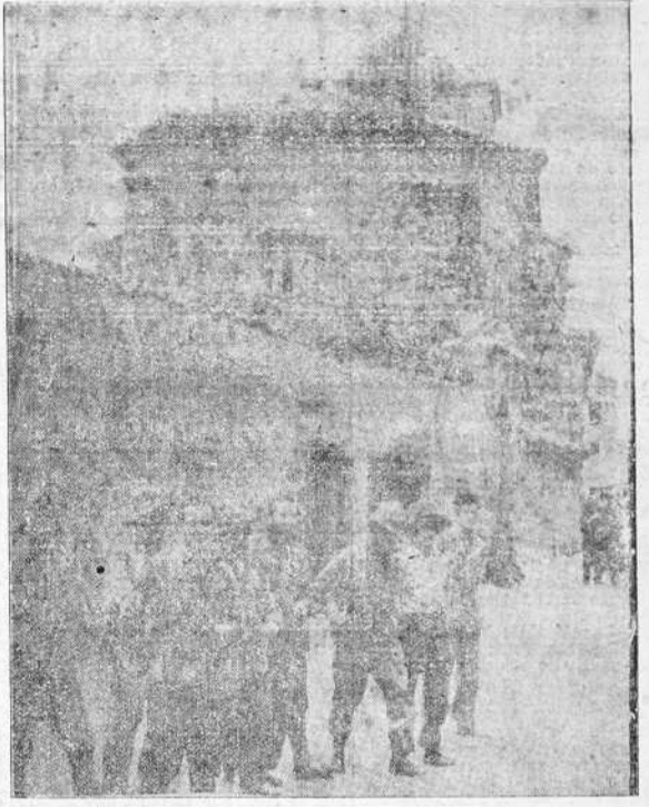
A pocos kilómetros de Teruel los soldados españoles esperan el momento glorioso de recuperar la ciudad martirizada por la bestia marxista, en estos momentos entregada, furiosa en su impotencia, a la acción destructora del fuego y la dinamita