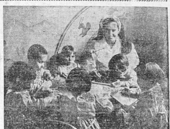
Las camaradas de la Sección Femenina llamarán hoy de nuevo a tu sentimiento de español. Tu generosa correspondencia a su "Auxilio Social, me hace el favor" es demostración evidente de que posees un sentido preciso y consciente de la fecunda finalidad del Movimiento.

Se sabe que los profesores y alumnos de la Universidad de Coimbra preparan un cariñoso recibimiento a los comisionados españoles.