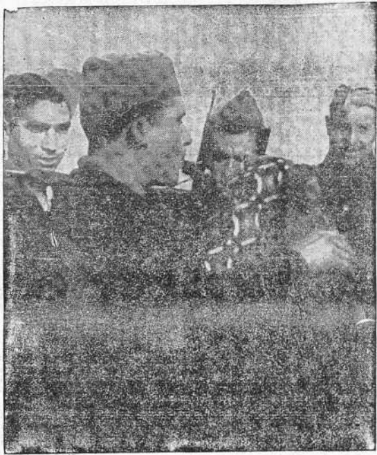
Soldados de Galicia en el frente