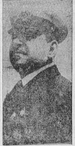
El mariscal soviético Blücher

PARIS 18.—En los círculos soviéticos de París se afirma que a consecuencia del incidente de Chang-Ku-Feng y la pérdida de prestigio sufrida por la U. R. S. S.