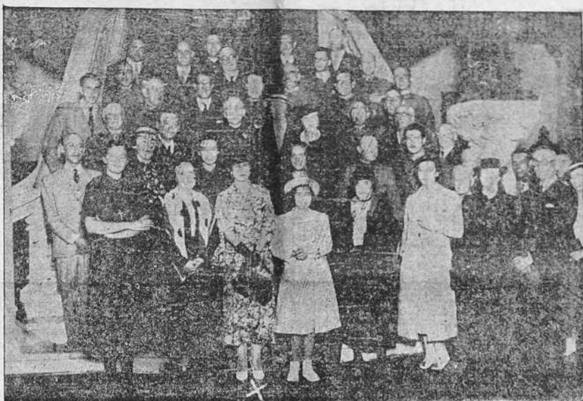
La esposa del Caudillo, doña Carmen Polo de Franco, y su hija Carmencita, acompañadas de las Autoridades y personalidades que acudieron a recibir las en su residencia de las Torres de Meirás.

BERLIN 18.—En nombre de la aviación francesa, el general Vuillemin entregó las insignias de la aviación de su país al mariscal Goering. Este, a su vez, entregó a su huésped las insignias de la aviación alemana.