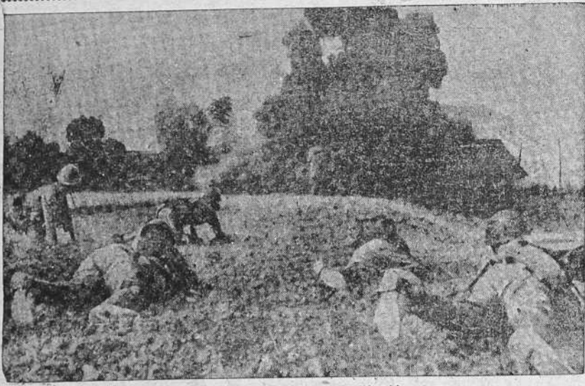
Los japoneses avanzando hacia una posición china