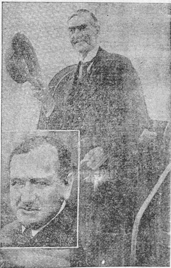
CHAMBERLAIN Y DALADIER

La España Una, Grande y Libre que estamos construyendo, necesita la ayuda de todos los buenos patriotas. Contribuye con tu grano de arena a fabricar los cimientos de la misma, entregando tu donativo para el Auxilio a Poblaciones Liberadas, en metálico o especies, en Real 76.