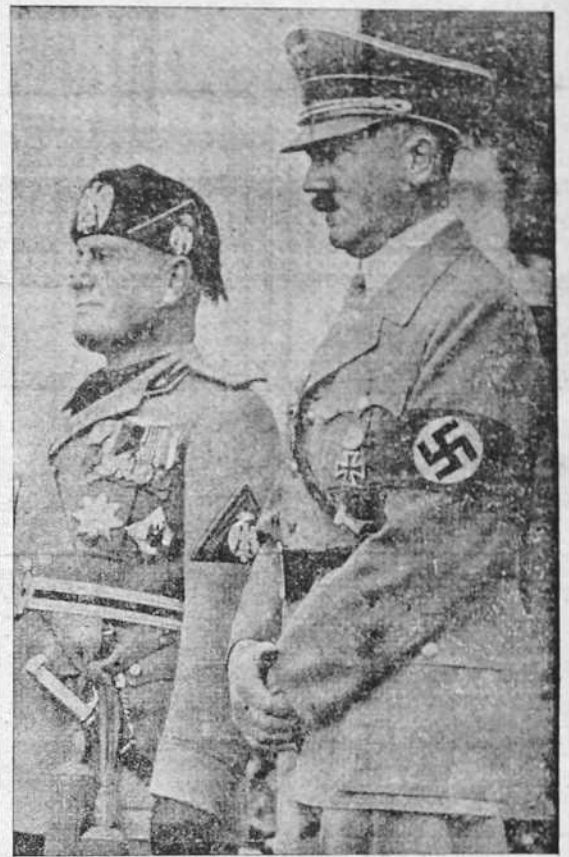
EL DUCE Y EL FUHRER

DURANTE UN BREVE DESCANSO EN LAS DELIBERACIONES CHAMBERLAIN RECIBIO A MASARYK Y MASTNY, EMBAJADORES DE PRAGA EN LONDRES Y BERLIN PARA DARLES CUENTA DE LOS ACUERDOS ADOPTADOS. SE IGNORA COMO REACCIONARAN LOS CHECOS ANTE EL CONVENIO DE LAS CUATRO GRANDES POTENCIAS.