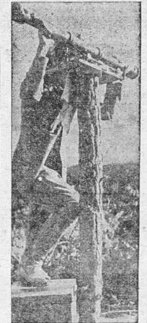
Observando los movimientos del enemigo

No escatimes para ellos la ayuda que precisas y entrega tu donativo a la Junta de Auxilio a Poblaciones Liberadas, en Real 76.