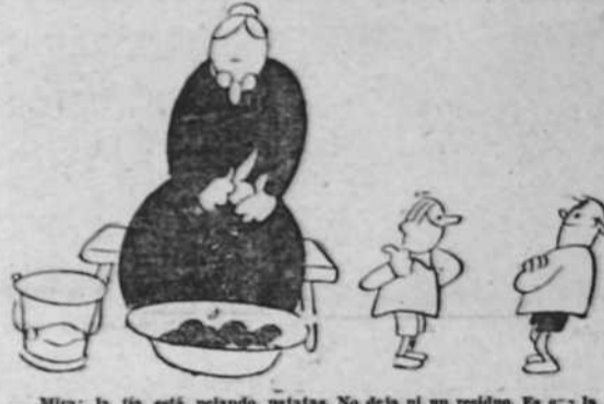
Mira; la tía está pelando patatas. No deja ni un residuo. Es que...