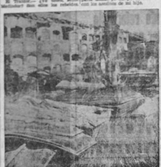
En la paz de los cementerios resplandeció la herida. He aquí cómo dejaron los rojos el de la ciudad de Huesca