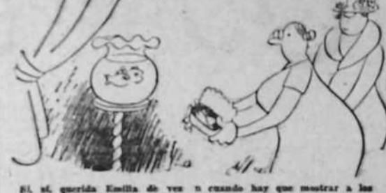
El señor querido Emilia de vez en cuando hay que mostrar a las...