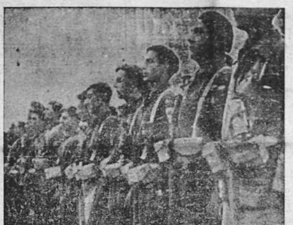
Muchachos de la Falange Española Tradicionalista formados en uno de los frentes

La circunstancia exigida por el Comité de No Intervención ha sido observada. Esperemos a que el Comité se decida a cumplir su plan y hacernos la justicia que se nos debe. Bien entendido—lo repetimos—que no solicitamos nada, sino que reclamamos el reconocimiento de un derecho.