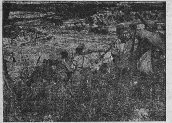
Soldados del Ejército nacional bajando una ladera en uno de los recientes avances.

siguiendo durante toda esta batalla. En Levante, los rojos han caído las posiciones conquistadas ayer por nuestras fuerzas e intentado un contraataque en