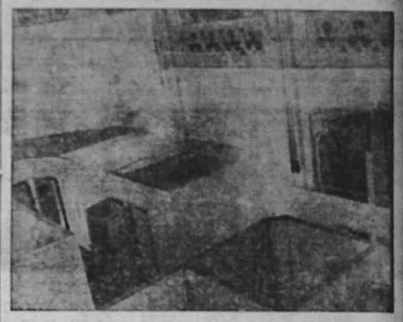
En lo que fué Altar Mayor del Convento de la calle de Vallmajor se instalaron las celdas de castigo que en nuestra fotografía aparecen. Pese a sus reducidas proporciones, en algunas de estas celdas llegó a haber en ocasiones quince detenidos.