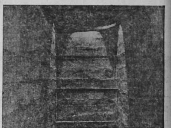
Mazmorra de tormentos de la checa de la calle de Vallmajor. Sométidos los presos en ella a la más completa oscuridad, sin sitio donde sentarse o reclinarse, un péndulo oscilaba constantemente, con su sonido isocrono, que solía producir en los presos espantosas perturbaciones mentales. (Foto CIFRA).