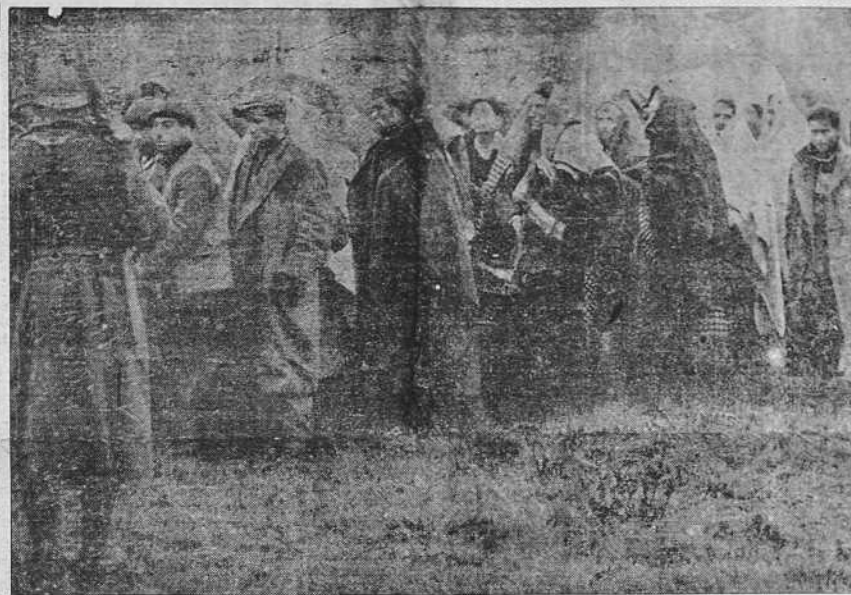
Mordiéndose el polvo de la derrota, los milicianos rojos se internan en Francia, y aquí aparecen, con sus caras lánguidas y su aire abatido, reflejo de su estado de espíritu. Entrada de un convoy de milicianos rojos desarmados, en Boulou, pueblo del territorio francés

Salamanca, 12 de febrero de 1939. III Año Triunfal. De orden de S. E., el general jefe de Estado Mayor, FRANCISCO MARTIN MORENO.