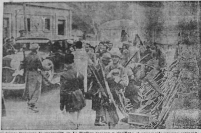
Las tropas francesas de guarnición en Le Perthus recogen y clasifican el armamento que van entregando los milicianos rojos al avanzar en Francia al huir de los avances del Ejército del Generalísimo Franco, en terrenos de Cataluña.

PARÍS, 13.—Los marxistas españoles organizaron el domingo por la tarde manifestaciones para conmemorar los sucesos del 4 de febrero de 1934. Los grupos delirantes a la persona, que poco más tarde han sido puestas en libertad.