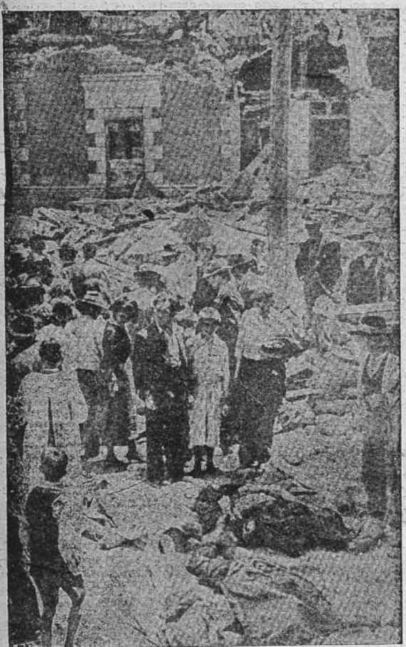
Chile sufrió recientemente los tremendos efectos de un terremoto que causó más de veinte mil muertos. En la fotografía aparecen las primeras víctimas del desastre, que fueron encontradas entre los escombros de las casas de la ciudad de Chillán, pueblo que sufrió en considerables proporciones los trágicos efectos del seísmo.

El burgoense de Bruselas, que a la vez es vicepresidente de la Cámara, ha declarado públicamente que los socialistas harán cuanto esté en su mano con objeto de impedir que Jaspar presida el nuevo Gobierno.