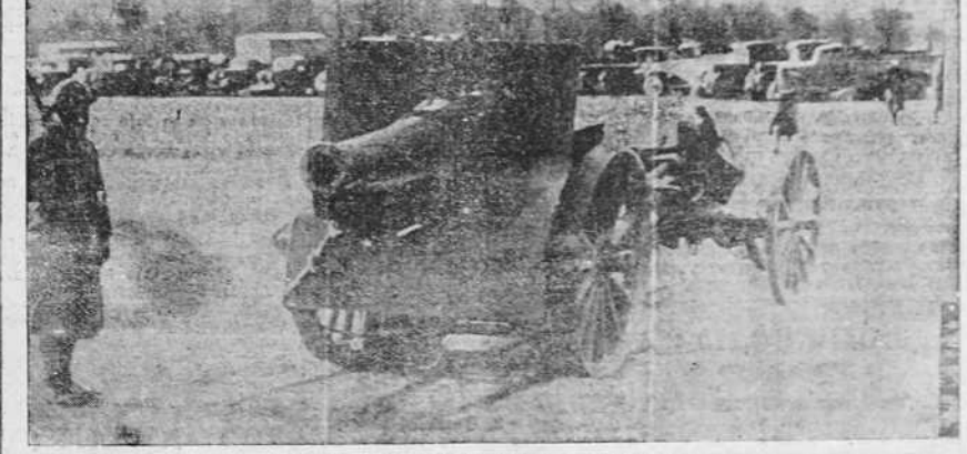
EL EXODO DEL EJERCITO ROJO A FRANCIA El ejército rojo de Cataluña ha atravesado los Pirineos en exilio de total derrota, y se ha internado en territorio francés. * Un soldado francés custodia, en el campo de Sallagouse, en las inmediaciones de Bourg Madame, un cañón del 154, arrestrado por los milicianos rojos en su huida.

El egoísmo de factura liberal ha muerto. En nuestro Estado sólo existe la hermandad entre todos los españoles.