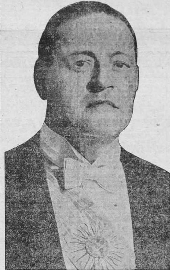
Doctor Roberto M. Ortiz, actual Presidente de La Argentina

España la "madre patria", y no la inmunda España roja de Osorio y Gallardo, debe llegarnos más al corazón. Es toda la América del Sur; es la hispanidad de aquel hemisferio, dominado por el prestigio de la ciudad del Plata por su Prensa, la más importante de las naciones hispanoamericanas; es el Nuevo Mundo, descubierto y colonizado por nuestros padres, que saluda la España Nacional, victoriosa y noble, como auténtica madre de la raza a la cual se enorgullecen de pertenecer.