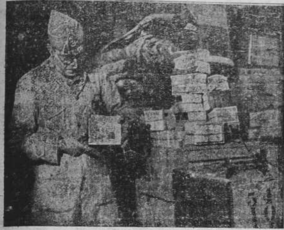
En la fortaleza de Figueras ha sido descubierto un enorme depósito de obras de arte, objetos del culto católico, valores extranjeros y alhajas de procedencia particular, robados por el ejército rojo y que se pudo éste llevarse en su huida a Francia.—Paquete de billetes del Banco, por un valor de varios millones de pesetas, que figuran en el enorme tesoro de objetos y valores robados por los rojos y descubiertos en los sótanos de la fortaleza de Figueras..