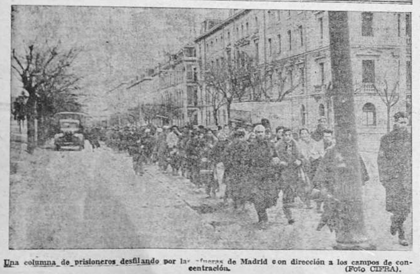
Una columna de prisioneros desfilando por la ciudad de Madrid con dirección a los campos de concentración.

En el castillo de Windsor Simulacro de ataque y protección aérea La familia real permaneció en los sótanos LONDRES, 12.—Esta tarde ha tenido lugar un simulacro de ataque y protección aérea en el Castillo de Windsor. Toda la familia real permaneció durante el ataque en los sótanos del castillo, habilitados al efecto. El ataque duró unos tres cuartos de hora, "cayendo" dos bombas en la calle del Norte y en la del Castillo". "El número de víctimas en este ataque simulado se eleva a 24".—Logos.