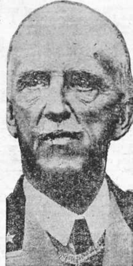
S. M. el Rey de Italia y Emperador de Etiopía, Victor Manuel III

men fascista y, con la ayuda del Gobierno de Roma, obtendrá beneficios morales y materiales.