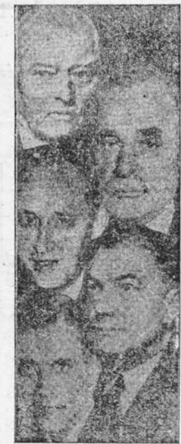
Probables sucesores de Roosevelt en la Presidencia de los Estados Unidos. De arriba abajo: Garner, Hull, Hopkins, Robert H. Jackson y Nutt

EL CAIRO, 12.—En los incendios que se han declarado en el Bajo Egipto, perecieron 32 personas y resultaron heridas más de 300.