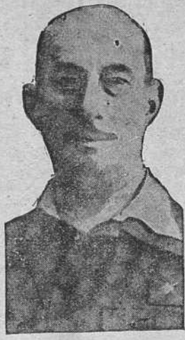
El general de brigada don Salvador Mújica Buhiras, ilustre hijo de Villagarcía...