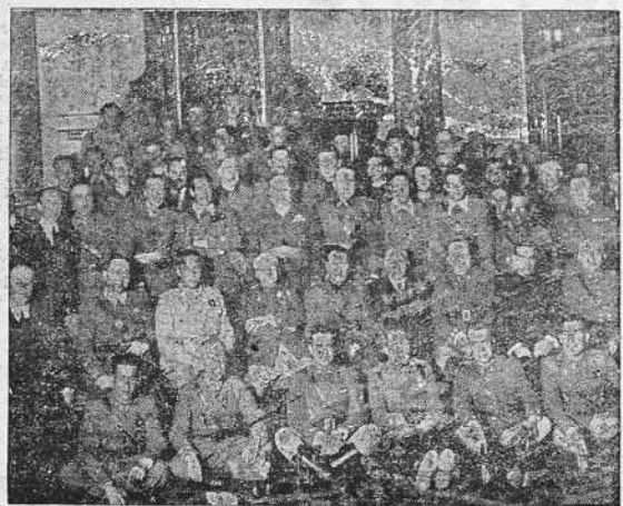
El general, jefes y oficiales de la División 82, acompañados de las autoridades coruñesas, en la recepción que en su honor celebró el Ayuntamiento.

Un día dijo el Caudillo que aspiraba a que 40 millones de españoles vivieran dentro del perímetro nacional. Con leyes como la que hoy comentamos esa aspiración de auténtico creador de pueblos será andando el tiempo una hermosa realidad.