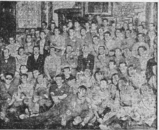
Los suboficiales de la 82 División reunidos en el salón de actos del Palacio Municipal, momentos antes de serles servido el vino de honor con que les obsequió el Ayuntamiento de La Coruña. (Foto El Ideal Gallego).