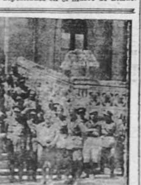
Las autoridades militares al salir de los funerales celebrados en la Iglesia de Santa María en homenaje a los gloriosos Caídos de los batallones del Regimiento de Infantería Zamora, número 25, pertenecientes a la División 21.

MADRID, 14. —Según datos recibidos en la Auditoría del Ejército de ocupación del Centro, son 236 los sacerdotes asesinados por el odio marxista, durante el último año, en la diócesis de Madrid.—(LOGOS).