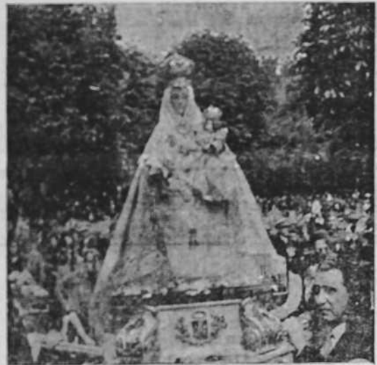
La imagen de la Virgen de Covadonga, que fue llevada por los rojos al extranjero, ha sido traída de nuevo a España.—La imagen de la Virgen de Covadonga, llevada en hombros por miembros de la colonia española en París, penetra en territorio español. (Foto CIFRA).

Quedó expuesta durante la noche en un altar instalado al aire libre