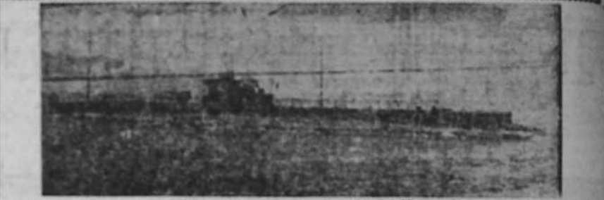
El submarino francés "Fenice", perteneciente a la escuadra del Mediterráneo, que acaba de partir.

EL TIEMPO.—Estado general atmosférico: Las altas presiones forman varios máximos; el más importante el de Irlanda, otro el de Noruega y otro sobre el Océano de Vinaya. Las bajas presiones se sitúan formando un mínimo en el Atlántico, hacia Terranova, y otro sobre Grecia. Temperaturas probables: Canarias Norte y Noroeste de España: Vientos fuertes del Norte; cielo parcialmente nublado. La temperatura oscila entre 20 como máxima y 11'7 como mínima.