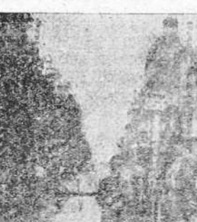
Soldados japoneses montando guardia en el límite de la Concesión francesa de Tien Tsin

SANGHAI 20.— El general-jefe de las tropas japonesas que actúan en Tientsin dio a la publicidad una nota sobre la tarea de las tropas de su mando en el bloque de las concesiones. La nota termina diciendo que los ingleses vulneraron los derechos de neutralidad dando acogida a los bandidos chinos en la concesión, lo que ocasionó serios perjuicios. No es propósito de Japón—prosigue—tomar la concesión británica por la fuerza, y lamentariamente que hubiese que hacerlo.