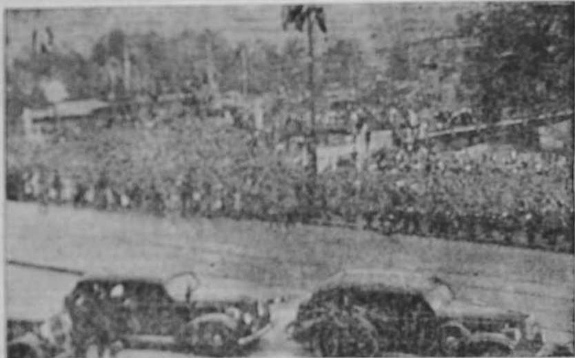
Aspecto que ofrecían las inmediaciones del punto base donde a la llegada del Caudillo al Ayuntamiento de Bilbao.

Antes había hablado a veinte mil obreros de los Altos Hornos, en medio de clamorosas ovaciones