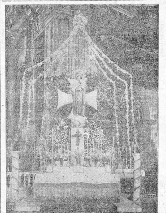
Artístico altar colocado en la iglesia parroquial de San Jorge con motivo de la festividad de Nuestra Señora del Perpetuo Socorro, Patrona de la Sanidad Militar.

Francia en Siria también sabían que la región era una provincia de Siria, y en el convenio turco-sirio de 30 de mayo de 1936, Turquía reconoce que formaba parte del Estado sirio y estaba sometido, como el resto del territorio, al régimen de Mandato. Además de esto se recuerda que las atribuciones del Mandato fueron otorgadas a Francia en 25 de abril de 1920 en la conferencia de San Remo y en dicha reunión el delegado italiano hizo una reserva, por ser Italia una potencia mediterránea. Fue aceptada la reserva por el Consejo Supremo, ya que constituía parte integrante de la comisión que concedió el Mandato a Francia, y por tanto existe un derecho por parte de Italia a intervenir en esta cuestión. Este derecho ha sido reconocido por pertenecer a la Conferencia de la paz en primer término, y en segundo por su calidad de potencia participante en el Consejo Supremo de los aliados. Por el primer tratado tiene derecho a exigir que no se alteren las funciones de cualquier Estado que ejerza poder sobre los que tiene mandato del grupo A, y por el segundo, exige, aun cuando no forme parte de la Sociedad de Naciones, que ese Mandato siga siendo desempeñado por la potencia mediterránea, en los límites que le fué otorgado por la conferencia de San Remo.