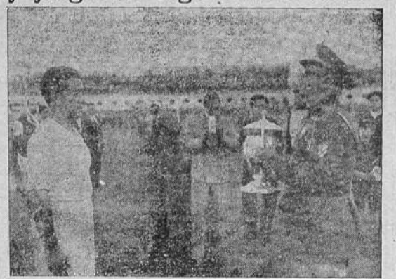
El general Moscardó entrega la Copa del Generalísimo Franco al capitán del equipo del Sevilla F. C., que venció sobre el Racing de Ferrol en el partido celebrado en Barcelona.

—¿Tendrán pronto algún partido para la presentación del equipo?—