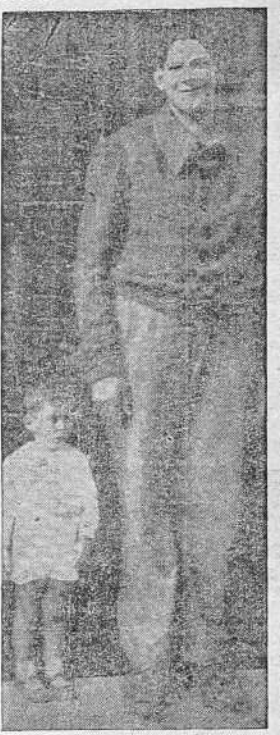
El gigante de 18 años de Allariz, de 270 metros de altura, a quien se pretende hacer émulos de Primo Carnera. (Foto Pacheco).