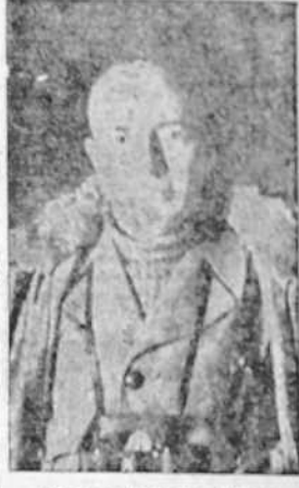
El general Martín Alonso

BUENOS AIRES, 19.—El Boletín del Estado publica entre otras las siguientes disposiciones: Ministerio de Defensa.—Decreto concediendo la Gran Cruz del Mérito Naval, con distintivo blanco, a los siguientes señores: Obispo Auxiliar de Toledo don Gregorio Modesto; contralmirante