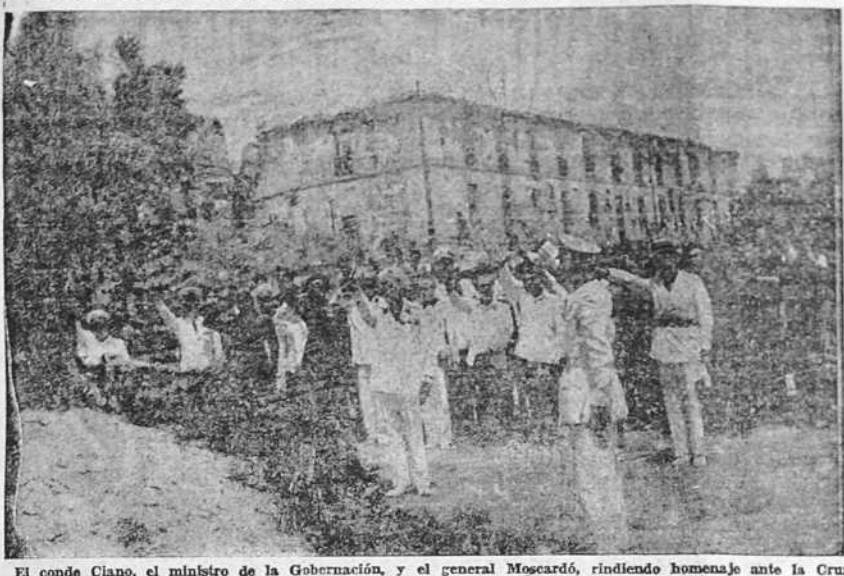
El conde Ciano, el ministro de la Gobernación, y el general Moscardó, rindiendo homenaje ante la Cruz de los Caídos levantada en las ruinas del Alcázar.

P A X JOVEN: —¿HAS PERTENECIDO A UN CENTRO DE VANGUARDIA DE LA JUVENTUD DE ACCION CATOLICA? DIOS, QUE TE HA ESCOGIDO PARA SER APOSTOL EN EL FRENTE, TE LLAMA AHORA A TI, Y A TODOS LOS QUE SIEN TAN EL APOSTOLADO, A CONTINUAR VUESTRA LABOR EN LOS CENTROS PARROQUIALES. EFFECTUA ESTA INCORPORACION EN LA "SECRETARIA DE APOSTOLADO CASTRENSE". SITA ACCIDENTALMENTE EN RIEGO DE AGUA 16-1.º ORCHA DE CINCO Y MEDIA A SIETE Y MEDIA LOS DIAS LABORABLES, Y DE CUATRO A NUEVE LOS DOMINGOS Y FESTIVOS. PIEDAD, ESTUDIO, ACCION