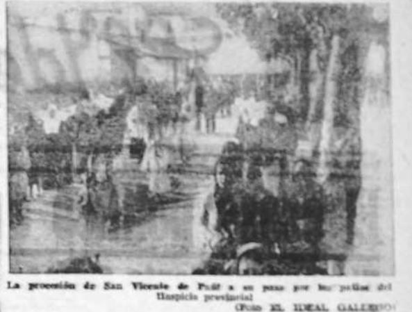
La procesion de San Vicente de Paul a su paso por las calles del Hospital provincial

Catedrático de la Facultad de Medicina, CIRUGIA GENERAL, Consulta y operaciones de los huesos, músculos, articulaciones, vasos y nervios