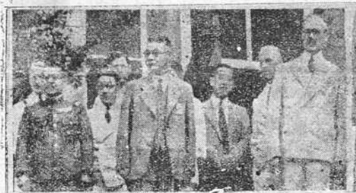
El general Arika Muto (a la izquierda) fotografiado con el señor Arita, ministro de Negocios Extranjeros del Japón (el centro) y sir Robert Craigie, embajador de Gran Bretaña (a la derecha), durante las conversaciones anglo-niponas, en el jardín del Ministerio de Negocios en Tokio.

En los centros internacionales se manifiesta que las opiniones de ambos periódicos reflejan fielmente el pensamiento de Stalin y también el de Molotov.