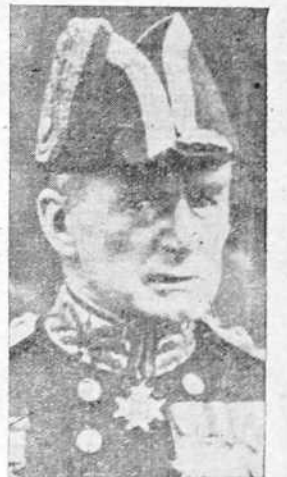
NUEVO ALMIRANTE DE LA FLOTA INGLESA

PARIS, 21.—Ante los comunicados recibidos de Londres y Tokio acerca de la situación en Extremo Oriente, afirmase que puede darse por segura e inevitable la ruptura de las negociaciones anglo-niponas. En los círculos políticos de París preocupa la repercusión que tal ruptura puede tener en el desarrollo de los problemas internacionales. Es imposible negar la gravedad de los acontecimientos en el Extremo Oriente y en Europa. Lo que ahora se desea es que la tem-