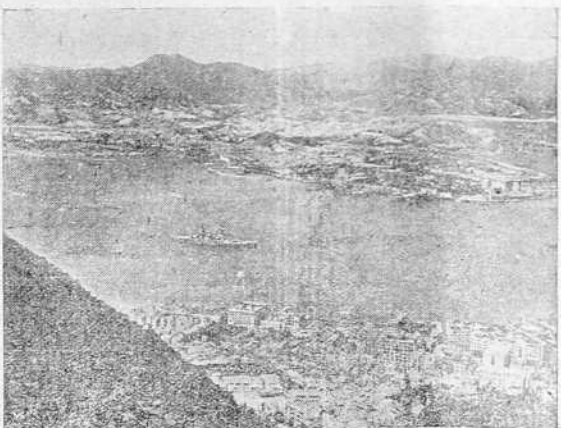
El puerto chino de Hong-Kong.—Centro de la atención mundial, en lo que al conflicto del lejano Oriente se refiere, es, en los actuales momentos, el puerto de Hong-Kong, cuyo bloqueo por las fuerzas navales japonesas se teme, y en el que los japoneses han establecido la base de la flota de China y han construido importantes fortificaciones.—Vista aérea del puerto.

Continúa manifestando que "The Times", de Londres, ha defendido en un artículo, "subsistente de amenazas, los supuestos derechos vitales polacos", estos derechos no se han discutido jamás y hubieran podido ser garantizados.