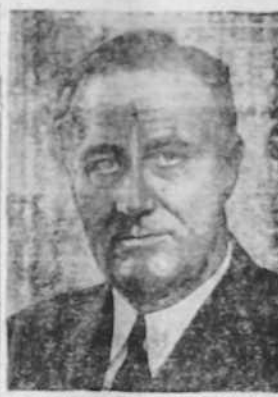
EL PRESIDENTE ROOSEVELT

SEVILLA, 5.—Al haberse cargo el teniente general don Félix Davila del mando de la Segunda Brigada del mando de la Segunda Brigada ha dirigido a las tropas a sus frentes un saludo, así como a todos