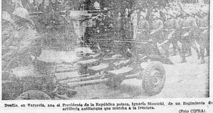
Desfile, en Varsovia, ante el Presidente de la República polaca, Ignacio Moscicki, de un Regimiento de artillería anticarro que marcha a la frontera.

Hizo la travesía a 30 millas, con las luces apagadas. ESTOCOLMO, 5.—Un pasajero que ha llegado desde Nueva York a bordo del "Europa", el transatlántico alemán de 48.000 toneladas, ha manifestado lo peligrosa que fué la navegación, efectuando a 30 millas de velocidad, con las luces apagadas, a través de una niebla espesa. Dice que ha sido sencillamente un milagro que el gigantesco buque haya podido llegar sin contratiempo al puerto de Bremen.