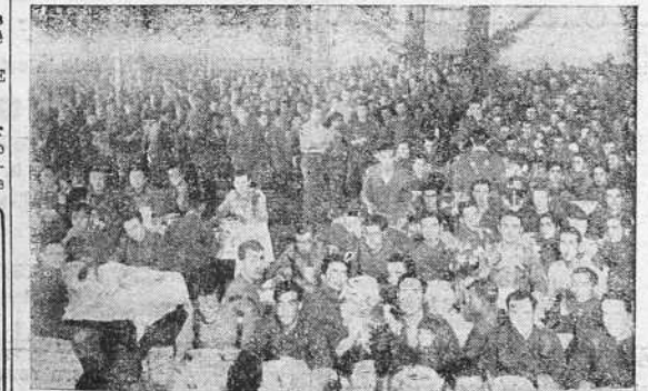
Un aspecto de la comida extraordinaria con que fueron obsequiados los soldados del 16 Ligero de Artillería antes de su traslado a otra Plaza.

PARIS, 16.—Un comunicado militar de esta tarde, da cuenta de haber empezado una ofensiva franco-inglesa. En esta ofensiva sobre