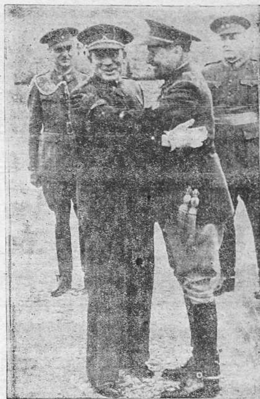
El nuevo jefe superior de las fuerzas militares de Marruecos, general Ponte, abrazando al general Saez de Buruaga a la llegada del primero a Ceuta para tomar posesión de su nuevo cargo.