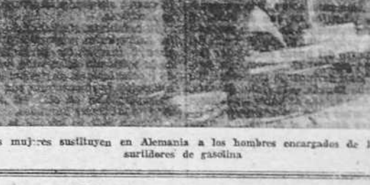
Las mujeres sustituyen en Alemania a los hombres encargados de las sartileras de gasolina.

PONTEVEDRA, 12.—Festajeando a la Virgen del Pilar, Patrona del Cuerpo de la Guardia civil, el personal de la Comandancia de esta capital organizó una misa que se celebró en el templo de San Francisco y a la que concurrieron todas las autoridades y numeroso público.