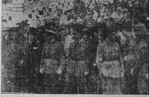
Las autoridades al salir de la iglesia parroquial de Santa Lucía donde se celebró una misa para solemnizar el día del Pilar.