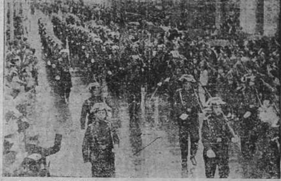
La Guardia civil desfilando por las calles del Ensanche después de la misa solemne celebrada con motivo de la fiesta de su Patrona.