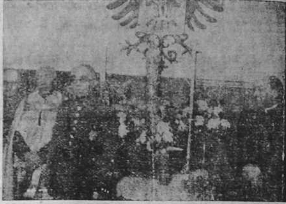
Entronización de la Virgen del Pilar Patrona de la Guardia civil, en el cuartel de dicho Instituto