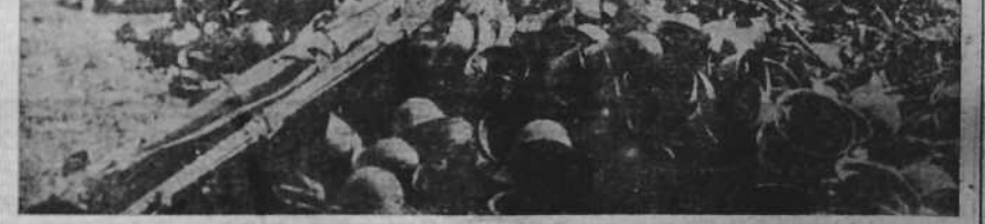
Soldados del Ejército alemán, clasificando el enorme material de guerra, capturado en la fortaleza de Modin. (Foto CIFRA).

En "Le Populaire", León Blum, que ha hecho una gran campaña para que se reuniese el Parlamento, manifiesta ahora que jamás ha pedido tal cosa. Blum no tiene