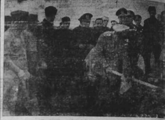
El Duce en la Via del Imperio visita los trabajos en curso y da comienzo a la construcción de otras obras

Los bonistas que en vez del reintegro opten por la nueva forma de pago, o por cualquiera de las estipuladas en la Escritura de emisión, deberán hacer uso de su derecho antes del 31 del corriente mes de octubre, mediante la oportuna suscripción en los Bancos aseguradores, sus Secursales y Agencias, entendiéndose, en otro caso, que optan por el reembolso en metálico el 31 de octubre de 1939, fecha en que deberá devengar el interés legal al Bono amortizado.