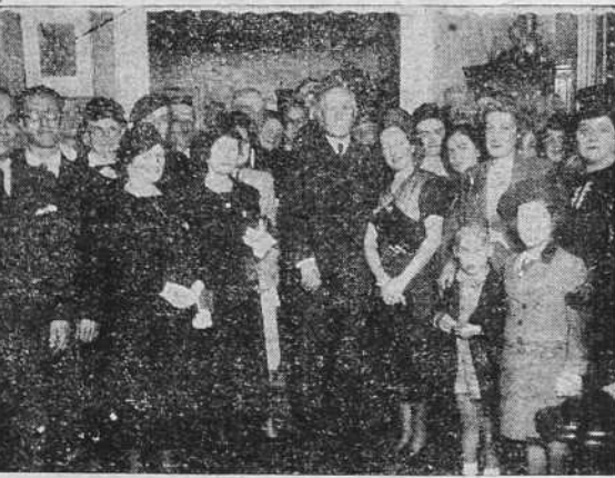
El mariscal Pétain en el Consulado de Francia rodeado de un grupo de sus compatriotas