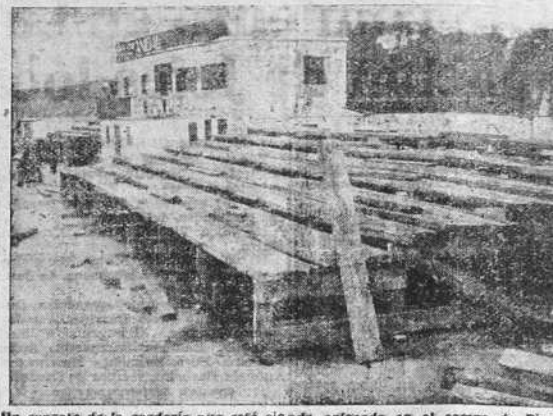
Un aspecto de la gradería que está siendo colocada en el campo de Riazor para el gran partido que jugarán el domingo el Deportivo y el Racing