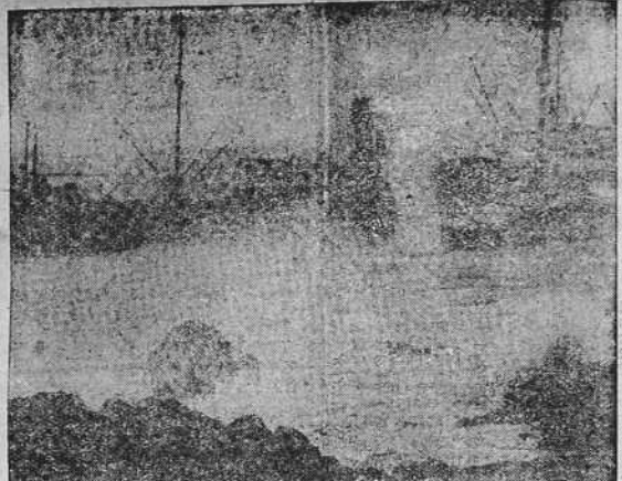
Barco partido en dos por el torpedeo de un submarino alemán. El ataque se verificó a pocas millas de la costa de Devonshire.