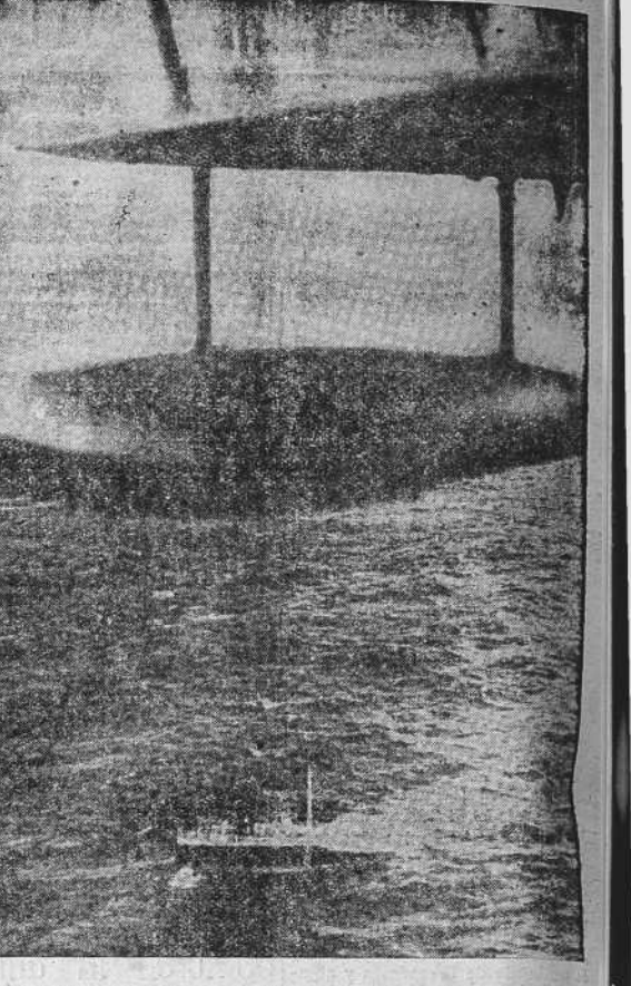
Un avión inglés en servicio de vigilancia sobre el mar del Norte, descubre un barco mercante que ha sido atacado por el enemigo, y avisa a un destructor para que recoja a los supervivientes.

Pará RIO DE JANEIRO, SANTOS, MONTEVIDEO y BUENOS AIRES, saldrá directamente de BARCELONA, el 27 de MARZO, el vapor: "PRINCESSA GIOVANNA" que admitirá solamente pasajeros de Clase Intermedia Económica, a los precios siguientes: PUERTOS DEL BRASIL Ptas: 1.737,50 DEL RIO DE LA PLATA " 2.042,50 Informa: DANIEL ALVAREZ Edificio Pastor. LA CORUÑA. "El Ideal Gallego", 12-3-40.