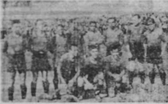
Equipo del Murcia, que al domingo fue derrotado en Riazor por el Deportivo