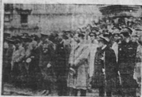
Las autoridades coruñesas presenciando el desfile de las fuerzas celebrado en el patio del cuartel de la Victoria.

Jefatura Provincial de Propaganda Pasividad