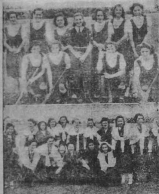
El equipo de hockey de la Falange femenina de Santander, que ayer jugó un partido con el equipo de La Coruña. Un grupo de muchachas que durante el descanso del partido cantaron bellas canciones regionales.