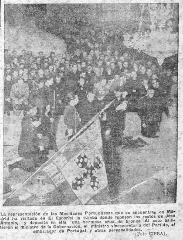
La representación de las Mocidades Portuguesas que se encuentran en Madrid ha visitado en El Escorial la tumba donde reposan los restos de José Antonio, y depositó en ella una hermosa cruz de bronce. Al acto asistieron el ministro de la Gobernación, el ministro vicesecretario del Partido, el embajador de Portugal y otras personalidades.

Se jugó el domingo en Riazor el partido de fútbol del torneo de campeones de grupo, de la segunda división, para el ascenso a la primera, entre los contra uno. Recoge este grabado el momento de producirse el segundo tanto del equipo local. (INFORMACION EN LA CUARTA PLANA).