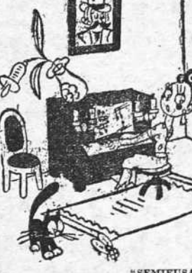
SEMIFUSAS

El trasatlántico "Normandie", hipotecado