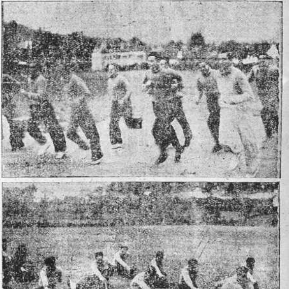
Los jugadores del Deportivo, que desde principios de semana están congregados en Arteijo, se dedican a realizar ejercicios gimnásticos al aire libre y a prepararse físicamente para el partido del domingo contra la Real Sociedad.

Hoy, jueves, habrá una afluencia en el programa habitual: por la tarde, el único entrenamiento con balón de la semana. El sábado, descanso absoluto, y el domingo, a las diez y media de la tarde, ¡a Riazor! Nos ha dicho, asimismo, Paco Graña, que el espíritu de los jugadores es formidable, y que una de las horas más animadas del día es la llegada de los ejemplares con que estos días les obsequia EL IDEAL GALLEGO. ¡Se los devorarán!—MARATHON.