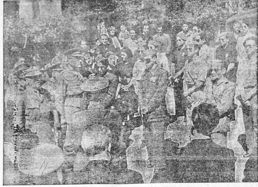
MADRID.—Con asistencia del director general de mutilados, general Millán Astray, se ha inaugurado el Hogar Escuelas Franco, para caballeros mutilados elegos.—Un grupo de mutilados, con sus enfermeras, momentos después de la inauguración. (Foto CIFRA).

Un aficionado de la Real Sociedad, que se parece al Mar del Norte al quinto delantero del Deportivo.