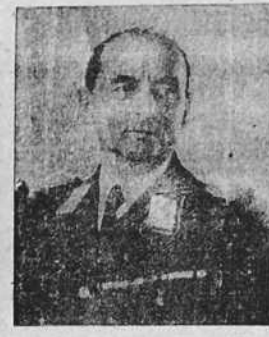
El general Kaupisch, comandante de las tropas alemanas motorizadas y de los carros de asalto