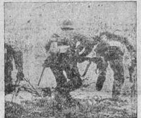
Soldados alemanos en un avance por territorio francés.

PARIS, 8.—Comunicado de la mañana: "Los elementos blindados enemigos, que fueron señalados anoche hacia el valle del Bresle, han actuado su