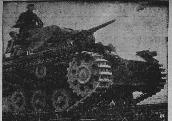
Carros blindados alemanes, atravesando vías férreas en su avance impetuoso.

NEW YORK 15.—Según el "New York Tribune" la Casa Blanca y el Departamento de Estado han desmentido los rumores según los cuales Francia e Inglaterra habían pedido la intervención de los Estados Unidos en la guerra.—(EFE).