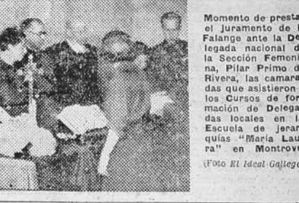
Momento de prestar el juramento de la Falange ante la Delegada nacional de la Sección Femenina, Pilar Primo de Rivera, las camaradas que asistieron a los Cursos de formación de Delegadas locales en la Escuela de jerarquías "María Laura" en Montrove.