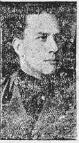
El conde Ciano.

MUNICH, 10.—Esta mañana, a las once, ha llegado el conde Ciano. Entre los miembros del séquito del ministro figuraba el embajador de Italia. Al mismo tiempo llegaron en otro tren especial el embajador de Alemania en Italia, von Mackenze, y el jefe del protocolo. El conde Ciano y su escolta fueron recibidos en el andén por von Ribbentrop y otras autoridades del Estado. Las Juventudes hitlerianas y las delegaciones del Fascio hacían guardia de honor en los andenes y en los vestíbulos de la estación. El ministro italiano, que fué recibido con un entusiasmo indescripible, pasó revista en el andén a la compañía de honor. Por parte de Hungría acudieron a la estación los ministros húngaros Sztajny y Chlozy.—(EFE).