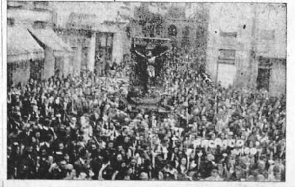
Procesión del Santísimo Cristo de la Victoria celebrada en Vigo, con más brillantez que en años anteriores.

Para los productores del mar tiene el Sindicato de Falange, la realidad de todas las promesas no cumplidas por quienes vivieron a cuenta del pescador.