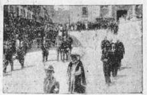
Las Autoridades al salir de la iglesia de San Jorge