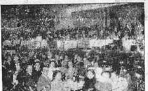
Dos aspectos de las animadas verbenas celebradas en el Parque del Casino de La Coruña