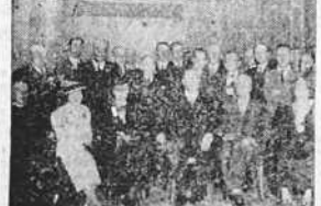
El retrato del pintor corués, José Seijo Rubio, que ha sido objeto de un homenaje en la Asociación de Artistas.