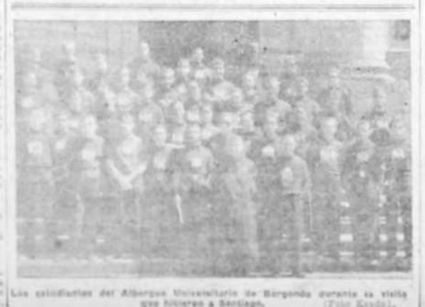
Los estudiantes del Albergue Universitario de Berganda durante la visita que hicieron a Santiago.