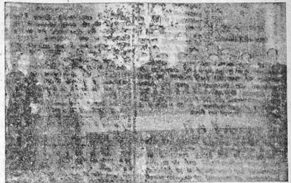
El Consejo Provincial de Organizaciones Juveniles que se ha constituido en La Coruña..

En un solo día se conquistó esta guerra. Aprovechando los "desuleidos" de cada momento, ha vuelto a absorber Besarabia, Estonia, Lituania, Letonia y parte de Polonia; pueblos que se segregaron del Imperio soviético a raíz de la guerra pasada. Sólo un pueblo resistió dignamente: Finlandia, y ante su valor indomable tuvo que ceder el coloso de los pies de barro, descubriendo al Mundo una miseria física y moral que difícilmente podía ocultar ya.