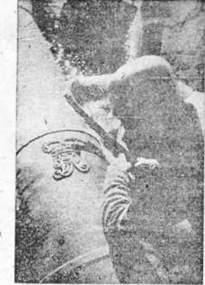
Este soldado alemán contempla las insignias de la artillería británica caída en poder de las fuerzas del Reich como consecuencia de la ocupación de la Isla de Guernsey.

LONDRES 31. —Neuter da cuenta de que cuatro aviones alemanes fueron derribados en el curso de un combate registrado sobre una ciudad costera del Sudeste de Inglaterra. Formaciones de bombarderos enemigos intentaron penetrar en el país, en el momento en que el ejército del aire británico se encontraba en la batalla de la D. C. A. Un avión alemán abatió fuego de ametralladora sobre un barrio de los alrededores de una ciudad del Sudeste. Muchas mujeres y sus hijos se refugiaron detrás de los árboles. Un caza británico persiguió el aparato enemigo y se cree que éste fue derribado algunos cientos de metros más lejos. Ha podido escucharse el ruido de un aparato alemán que de vez en cuando ha volado sobre la región londinense, así como el ruido de lejano cañoneo. Las columnas de humo de los centenares de chimeneas de la región de Londres prueban que las fábricas continúan trabajando sin interrupción.—(EFE).