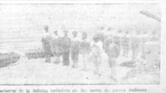
Mariahuete de la defensa antiaérea en los nevados de zona italiana.

Dice "Relazione Internazionale" ROMA 31. —"Relazione Internazionale" comenta el primer aniversario de la guerra y dice que Inglaterra debe perder todas sus posesiones africanas, que debe renunciar por sus errores a las posesiones de Libia y Etiopía. Francia e Inglaterra han causado un innecesario dolor a la civilización por llevar a Europa a la guerra y deben pagar sus platos.—(EFE).