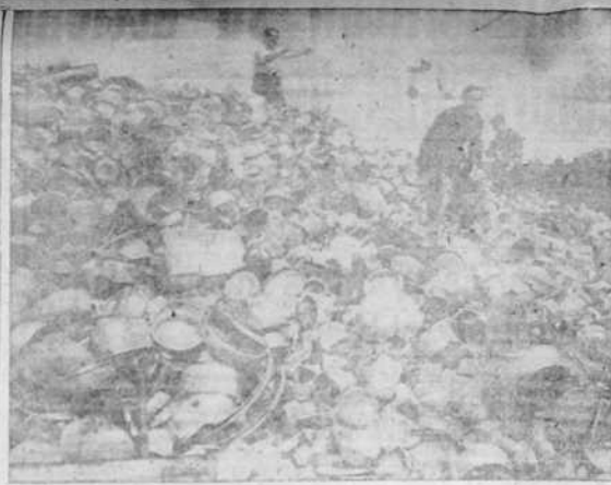
Enormes cantidades de utensilios de aluminio, pertenecientes a baterías de coquina, son entregados por los ingleses, en respuesta al llamamiento hecho en tal sentido por el ministro del Aire. En el grabado aparece uno de los grandes depósitos de cacharros de dicho metal, en Londres

BARCELONA 31.—Presidente de la Junta ha llegado a Barcelona el donativo que los católicos alemanes envían a España. Se trata de 20 toneladas de objetos para el culto de las iglesias saqueadas. Entre los objetos que forman el donativo figuran 20 toneladas de objetos para el culto de las iglesias saqueadas, 20 toneladas de objetos para el culto de las iglesias saqueadas, 20 toneladas de objetos para el culto de las iglesias saqueadas.