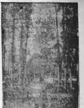
Entrada a la Academia de Mandos, instalada en Montrove y que ha sido inaugurada el domingo último.

MADRID, 2.—E. el Jefe del Estado llegó anoche a Madrid, procedente de Galicia. Esta mañana despatchó en El Pardo con algunos jefes de los Departamentos ministeriales.—(GRTA).