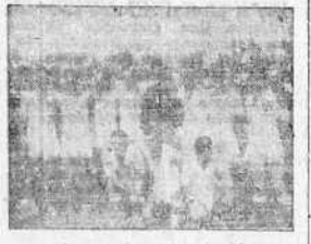
Equipo del Club Celta