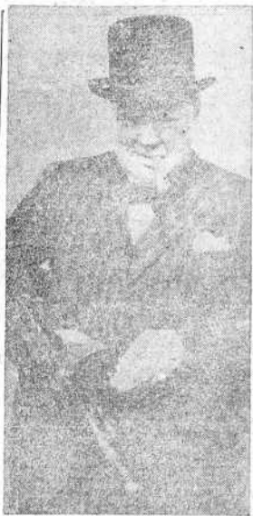
WINSTON CHURCHILL examina una ametralladora, durante la reciente visita que hizo a las defensas de la costa Noroeste de Inglaterra

A LOS LECTORES DE EL IDEAL GALLEGO Rogamos a nuestros suscriptores y lectores de la Región perdonen el retraso con que, temporalmente, recibán nuestro periódico; retraso debido a dificultades en los transportes.