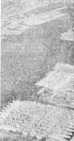
Los destructores norteamericanos que participaron en la Gran Guerra y que ahora han sido traspasados a Inglaterra a cambio de bases militares en las posesiones británicas del hemisferio occidental. Antes de zarpar para su destino, los navíos fueron concentrados en el puerto de Filadelfia

Poco después entró el primer ministro, Churchill, para pronunciar su discurso sobre la situación de la guerra, y fué acogido con grandes aplausos. Sin embargo, el "speaker" informó a la Cámara que se esperaba un imminente ataque aéreo y suspendió la sesión.—(EFE).