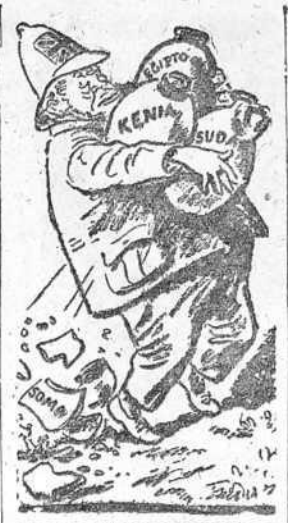
LOS CANTAROS DE JOHN BULL.

OTAWA 7.—Ha llegado un transporte inglés a cierto puerto canadiense, conduciendo marineros ingleses, que se harán cargo de los destructores cedidos por Norteamérica. NUEVA YORK 7.—Según "New York Times" va a ser recomendado a