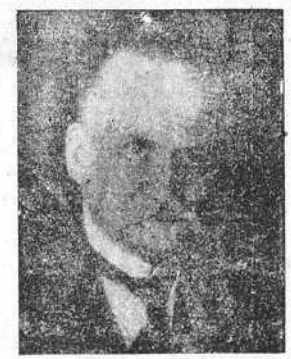
HELSINKI 7.—(730 tarde). — El presidente del Estado finlandés, Kallio, ha fallecido en la tarde de hoy, a consecuencia de la grave enfermedad que padecía.—(EFE).

El Presidente de Finlandia, Kallio, falleció ayer