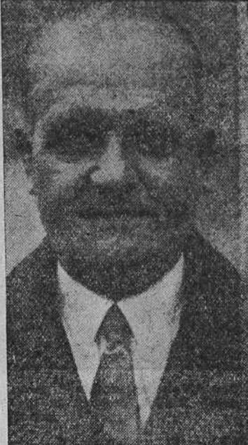
MADRID, 11.—Datos biográficos del nuevo embajador de la Argentina, que ha presentado esta mañana sus cartas credenciales al Jefe del Estado.