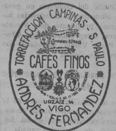
CACAOS, TÉS Y YERBA MATE

Para amenizar las fiestas patronales que se celebrarán en esta villa los días 7, 8, 9 y 10, de septiembre, ha sido contratada la brillante banda militar del regimiento de Zaragoza, que guarnece la plaza de Santiago.