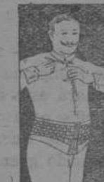
FAJA DE CABALLERO