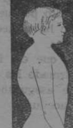
MAL DE POTT