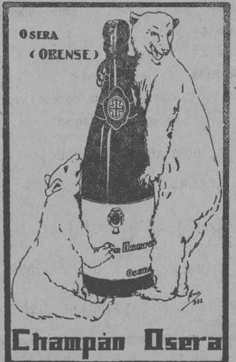
DE VENTA EN PRINCIPALES ULTRAMARINOS