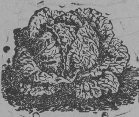
Lechuga de Repollo

Semillas de todas clases: hortalizas, forrajeras, y flores.