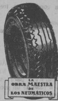
LA OBRA MAESTRA DE LOS NEUMÁTICOS