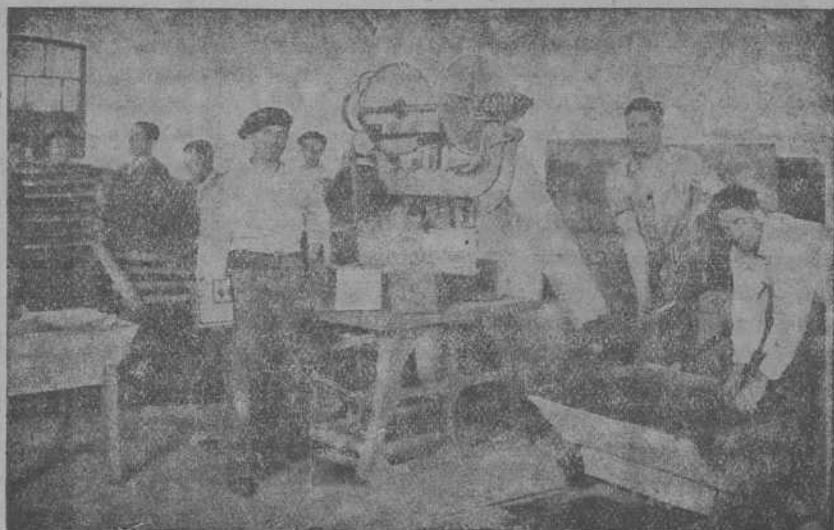
Vista de la sección de mosaico

Las especialidades de esta Fábrica, se basan en la fabricación de: Teja plana y curva, mosaicos, tuberías, etc., por disfrutar de excelentes y seleccionadas arenas, mezcla mecánica y riego por cámara pulverizadora.