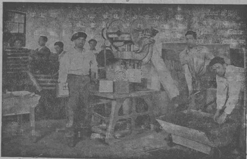
Vista de la sección de mosaico

Las especialidades de esta Fábrica, se basan en la fabricación de: Teja plana y curva, mosaicos, tuberías etc., por disfrutar de excelentes y seleccionadas arenas, mezcla mecánica y riego por cámara pulverizadora